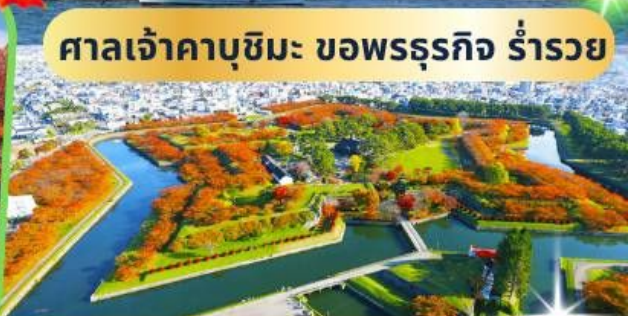
ศาลเจ้าคาบูชิมะ ขอพรรฐุกิจ ร่ำรวย