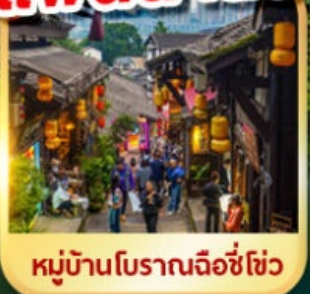
หมู่บ้านโบราณฉือชี่ฮั่ว