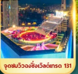
จุดชมวิวฉางชิ่งเวิลด์เทรด 131