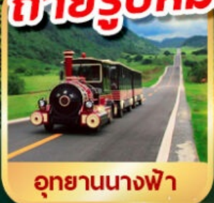
อุทยานนางฟ้า