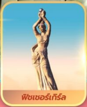
ฟิชเชอร์เทียร์ล