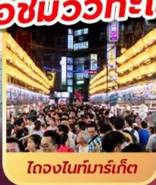
ไถจงไนท์มาร์เก็ต