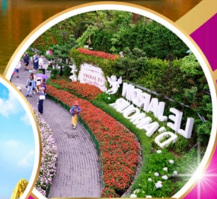
Le Jardin d'Amour