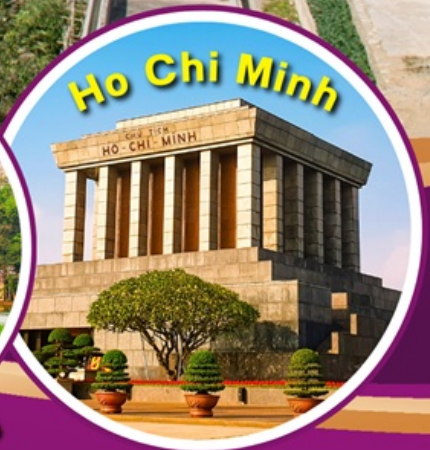
Ho Chi Minh