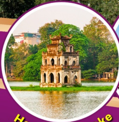
Hoan Kiem Lake