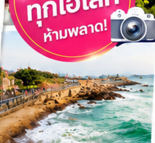
ทางเดินเลียบชายหาด Qingdao Seaside Path