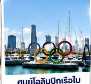
ศูนย์โอลิมปิกเรือใบ Qingdao Olympic Sailing Center