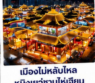
เมืองไม่หลับไหล หมิงเยว่ชานไห่เจี้ยน Mingyue Shanhai Jian Night City