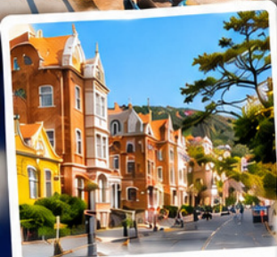
ปาต๋ากวาน Badaguan