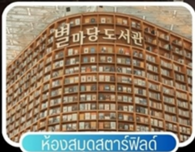
ห้องสมุดสตาร์ฟิลด์