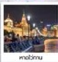
วัดอูเจิน