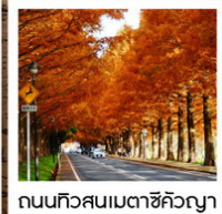
ถนนทิวสนเมตาชิคิวญา