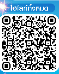
ไอโลกัทั้งหมด

มกราคม - มีนาคม 2570 ราคาเริ่มต้น 44,899