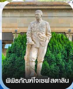
พิพิธภัณฑ์โจเซฟ สตาลิน