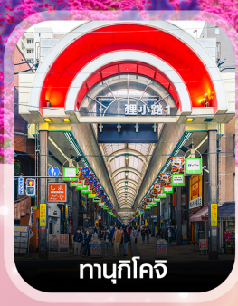
ทามุกิโคจิ