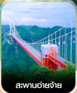
สะพานอ้ายจ้าย