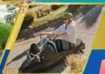
เล่นลuge ที่กรีนสทาวน์

AUCKLAND / ROTORUA / CHRISTCHURCH FOX GLACIER / FRANZ JOSEF / QUEENSTOWN พิกจ็อคแลนด์ 2 คืน / โรโตรัว 1 คืน / พิกโครสต์เฮิร์ธ 2 คืน พิกฟรานซ์โจเซฟ 1 คืน / กรีนสทาวน์ 2 คืน