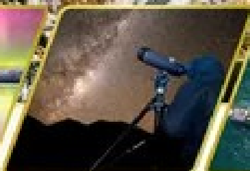
กิจกรรมชมทิวไรต์ดูดาว