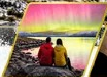
ตามล่าหาแสงใต้