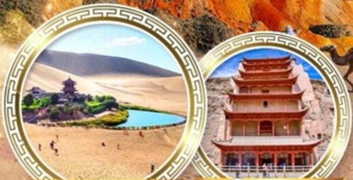
ทะเลจีนทรายเขียว