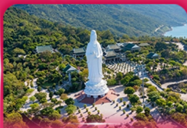
องค์กวนอิม วัดหลินอึ้ง