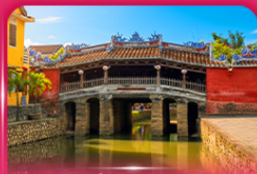
สะพานญี่ปุ่นโบราณ ฮอยอัน