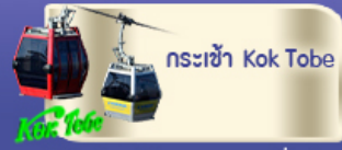
กระเช้า Kok Tobe