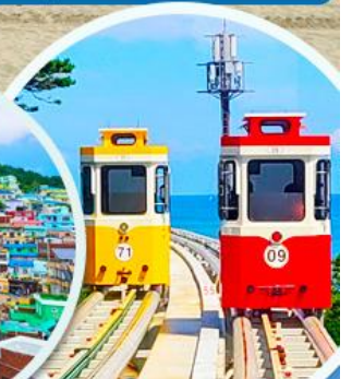
นั่งรถไฟปู๊กบีก

ราคานี้รวมค่าภาษีน้ำมัน + ค่าภาษีสนามบิน ** ปรับขึ้น ณ วันที่ 1 เม.ย. 69 เรียบร้อยแล้ว **