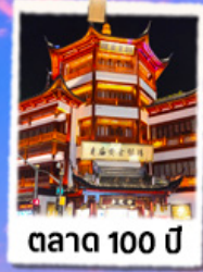
ตาด 100 ปี