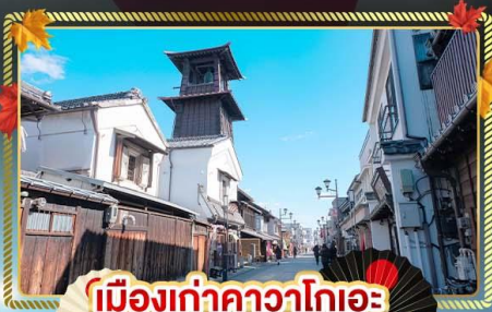
เมืองท่าคาวาโกเอะ

ชมธรรมชาติกลางหุบเขาจากแปนแอลป์ “คามิโคจิ” เที่ยวครบทุกวัน เก็บทุกไฮไลต์ คาวาโกเอะ มัทสึโมโตะ ฟุจิ