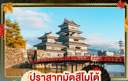
ปราสาทมัทสึโมโตะ