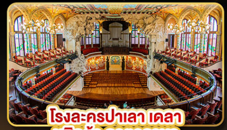
โรงละครปาเลา เดลา มูสิกา คาทาลานา