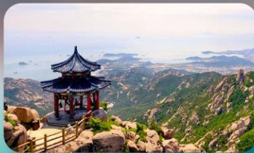
กูเจาเหล่าซาน