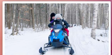
ขี่รถ SNOW MOTORCYCLE