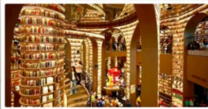
ร้านหนังสือจชุก่อ