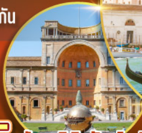
เข้าชมพิพิธภัณฑสถานวาติกัน