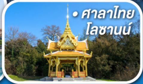
• ศาลาไทย โลซานน์

• สุดอากาศดีดีที่ซอร์แมก • ขึ้นกระเช้าสู่ยอดจากกลาเซียร์ 3000 • ชมเมืองคลาสสิกเบิร์น ลูเซิร์น ซูริก