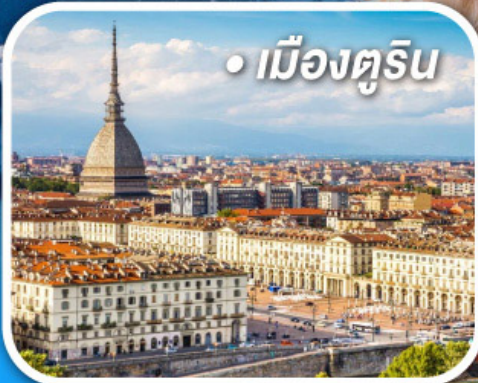
• เมืองตูริน