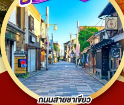
ถนนสายชาเขียว