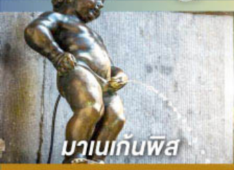
มานเกินพิส