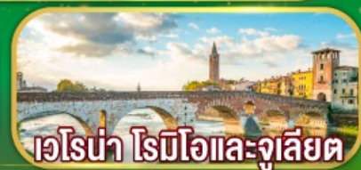
เวโรน่า โรมีโอและจูเลียต