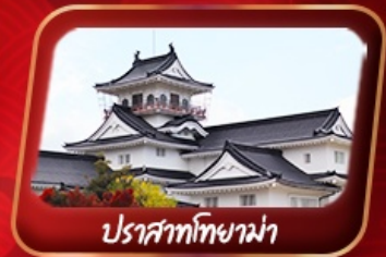
ปราสาทโทยาม่า