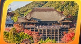
วัดคิโยมิสุเดระ