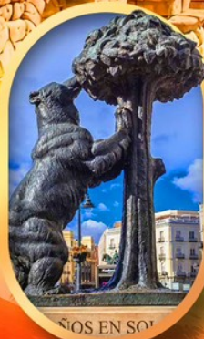
อนุสาวรีย์หมี