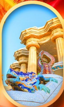
ปาร์ค กูเอล