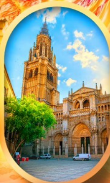
มหาวิหารโตเลโด