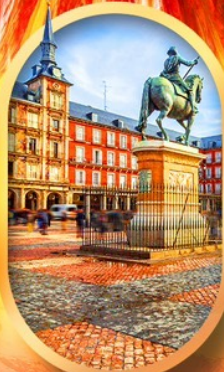
พลาซามายอร์