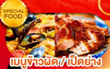
เมนูข้าวผัด/เป็ดย่าง