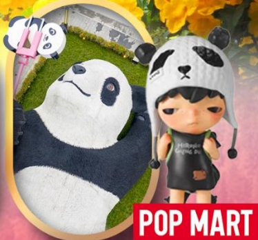
หมีแพนด้าเซลฟ์