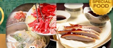
เมนู: สุกี้ม้งโก + เปิดปักกิ่ง เดินทาง เม.ษ. - ต.ค. 69