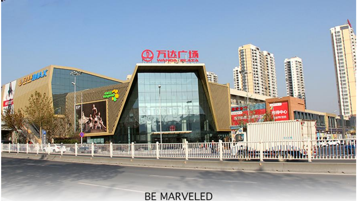
BE MARVELED ช้อปปังศูนย์การค้า (Qingdao Wanda Plaza)

ที่พัก HOLIDAY INN EXPRESS QINDAO หรือเทียบเท่าระดับ 4 ดาว