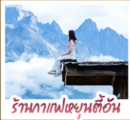
ร้านอาหารฟิชเชียนตี้ฮัน

21 - 27 ต.ค. 69 24,900 | 23 - 29 ต.ค. 69 25,900 22 - 28 ต.ค. 69 24,900 | 28 ต.ค. - 03 พ.ย. 69 24,900