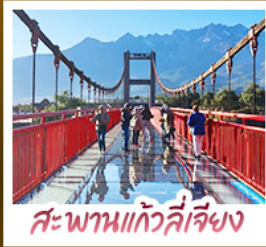
สะพานแกวี่ลี่เจียง