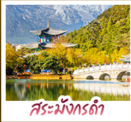
สระมัจกรดา