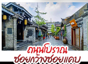
ถนนโบราณ ชอยกวางชอยแคบ