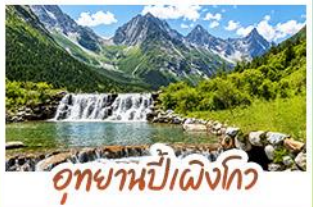
อุทยานปี่ฝิงโกว