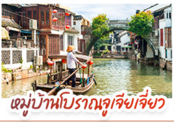
หมู่บ้านโบราณจูเจียเจียว

สวนสนุกเซี่ยงไฮ้ดิสนีย์แลนด์ เต็มวัน (รวมรถรับ-ส่ง)