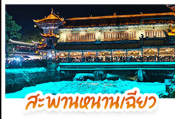
สะพานเทียนเหมินเฉียว