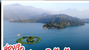
ล่องเรือทะเลสาบสุริยัมจินตรา