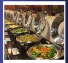
RENYI LAKE HOTEL

หมายเหตุ: **ปัจจุบันโรงแรมได้หวั่นมีนโยบายเพื่อลดโลกร้อน ตั้งแต่ปี 2568 เป็นต้นไป** โรงแรมที่พักงดบริการแจก สบู่ แชมพู ครีมนวด และผลิตภัณฑ์ดูแลผิวส่วนรวม *สิ่งที่ต้องเตรียมของใช้ส่วนตัวไปเอง! ครีมนวด แชมพู ครีมนวด โลชั่น หมวกอาบน้ำ ทวี แปรงสีฟัน ยาสีฟัน และของใช้ส่วนตัวอื่นๆ เพื่อสุขอนามัยที่ดีและเป็นมิตรกับโลกลดโลกร้อนรักษ์โลก...พกของใช้ส่วนตัว สบายใจ ไร้กังวล