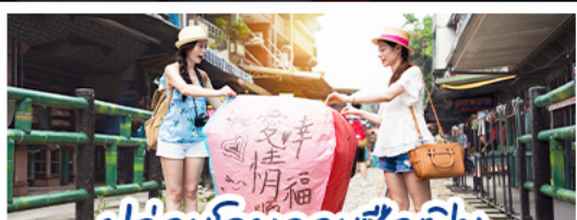
ปลั๊อคอมลอยซ็องเฟิ่น