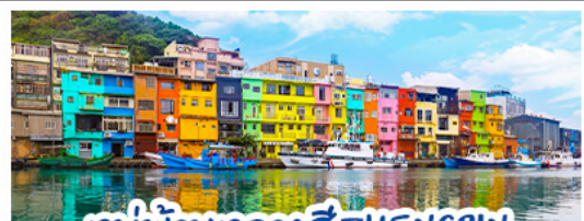
หมู่บ้านหลากสี ZHENGBIN