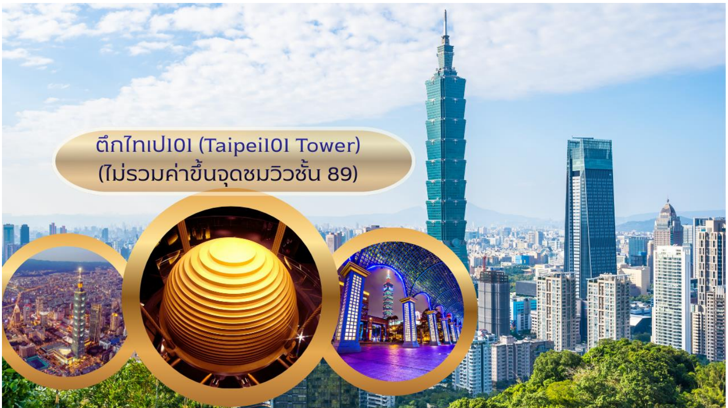
ตึกไทเป101 (Taipei101 Tower) (ไม่รวมค่าขึ้นจุดชมวิวจนชั้น 89)

อดีตยังคงสูงที่สุดในโลก ตึกไทเป 101 ยังคงความเป็นที่ 1 ไปได้คือลิฟต์ที่เร็วที่สุดในโลก ใช้เวลาขึ้นถึงชั้น 89 เพียงแค่ 37 วินาทีเท่านั้น (ไม่รวมค่าขึ้นจุดชมวิวจนชั้น 89) ** ท่านสามารถเลือกซื้อ Optional บัตรชม ตึกไทเป 101 วิวชั้น 89 ผ่านทางบริษัททัวร์ กรุณาแจ้งความประสงค์ ณ วันจองทัวร์ หรือแจ้งล่วงหน้าก่อนการเดินทางก่อนเดินทางอย่างน้อย 7 วันทำการ**