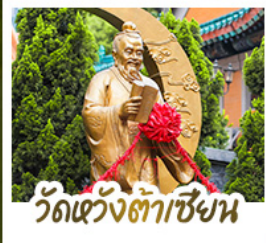
วัดเว่งตำเซียง