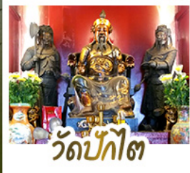
วัดปักไต้