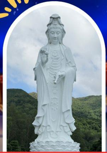
วัดชีซัน