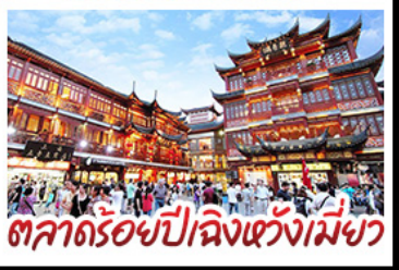
ตลาดร้อยปีฉิงหวังเมี่ยว