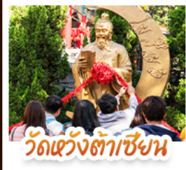
วัดเข่งงิ้ว