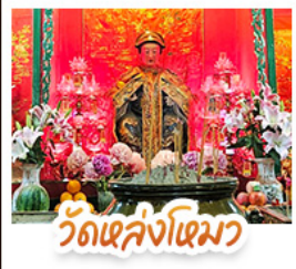
วัดเล่งโง้ว

นั่งรถรางพิกแถมสู่ TOP OF PEAK • ซ้อมปังจุใจมก และ CITYGATE OUTLAETS • นั่งกระเช้าองปิง สักการะพระใหญ่เทียนถาน • จอพรเจ้าแม่หล่งโหมว แม่จอง 5 มังกร ให้ประสบความสำเร็จในทุกๆ ด้าน