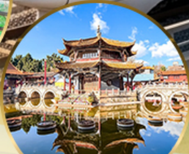
วัดหยวนทอง