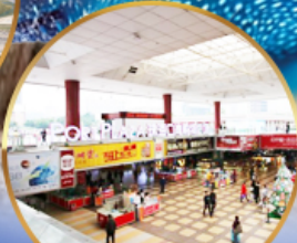
ตลาดกึ่งเปย์